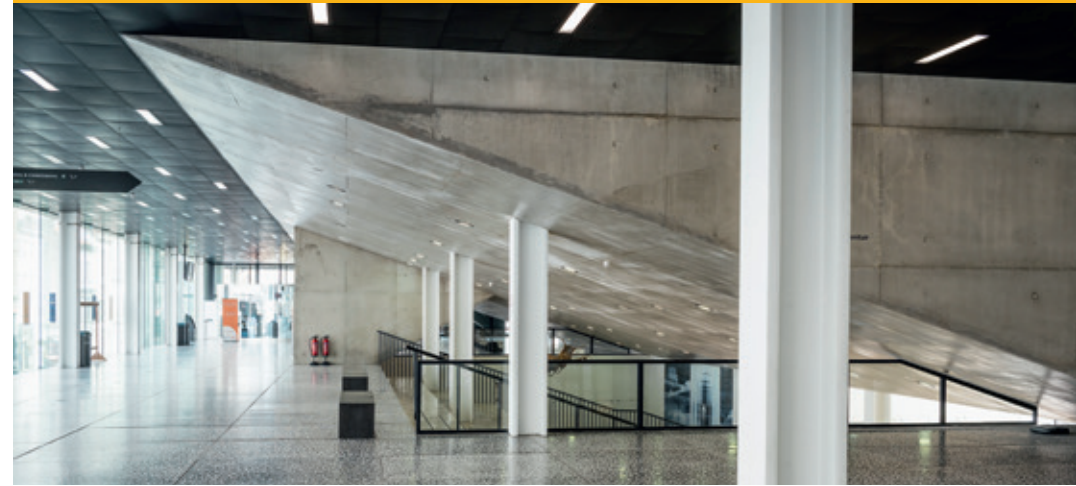
📍 Belangrijkste leslokalen eerste jaar bachelor Geschiedenis